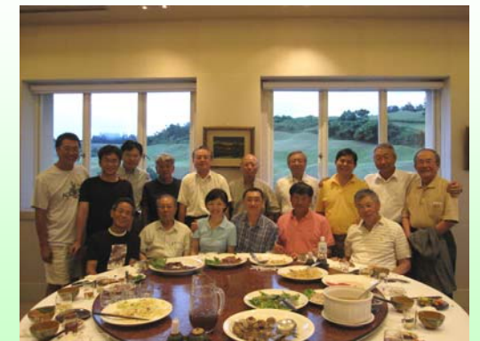
T.K. 隊長保證會用心經營球隊