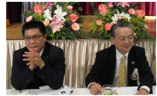
兩位再熬幾年也可以像 IPP. C.P.A. 一樣光榮”退役”