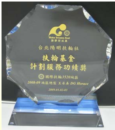
扶輪基金計劃服務功績