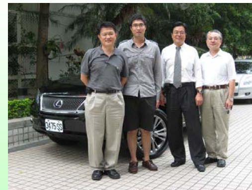
Aircon 剛買了節能減碳環保概念車