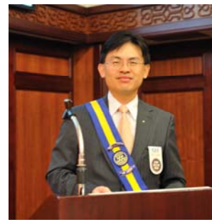
Accountant:當節目主委 比當糾察更硬斗