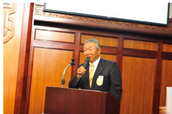
ROMEO 開始適應 4 年 HeadTable 生涯