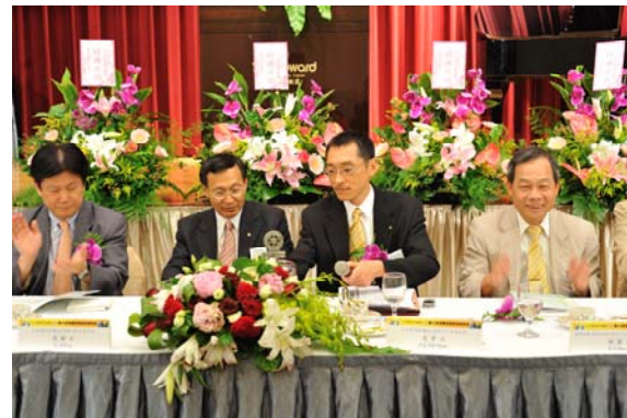
敲響任重道遠的鐘