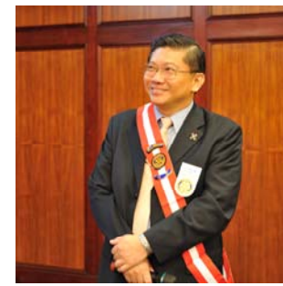
K&R:安排到 KTV 練 唱扶輪歌也不錯喔