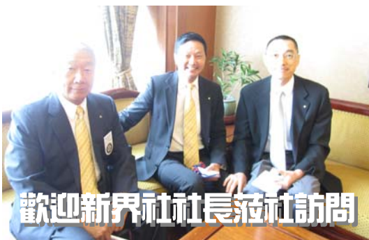
歡迎新界社社長蒞社訪問