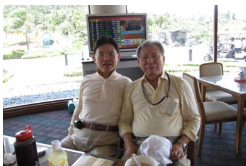
賣店小姐以為兩位是父子!像嗎?