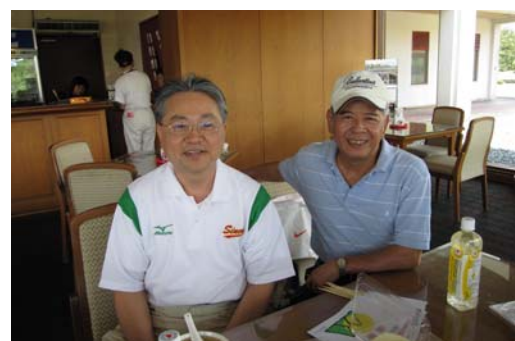
T..K 隊長+花錢總幹事=預算無上限