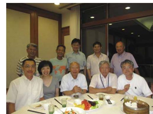
P.P.MAC 火速飛奔出席吃紅鯛大餐