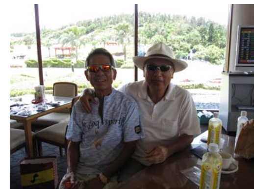
有緣無緣大家來作伙..快樂黑狗兄

BIRDIE: TONY X 2 第二桿近洞獎: P.P.ERIC、TONY 遠距獎: TONY 近洞獎: P.P.ERIC、P.P.ROGER TONY、P.PATENT 大波獎: P.P.AGENT 小波獎: TONY 平波獎: P.P.ERIC 第五名: P.P.ROGER B.B.獎: P.P.AGENT LUCKY7: P.E.T.K. 第四名: ACCOUNTANT 季軍: P.PATENT 亞軍: P.P.ERIC 冠軍: TONY