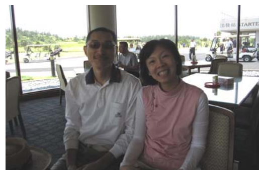
嫩草配 XX..幸福無限好?!