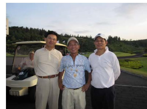
推桿不太順千萬不可以怪果嶺差