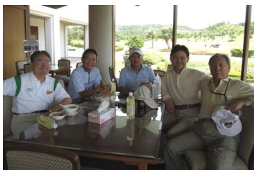
四位陳姓社友三位摸中折價券!福氣啦