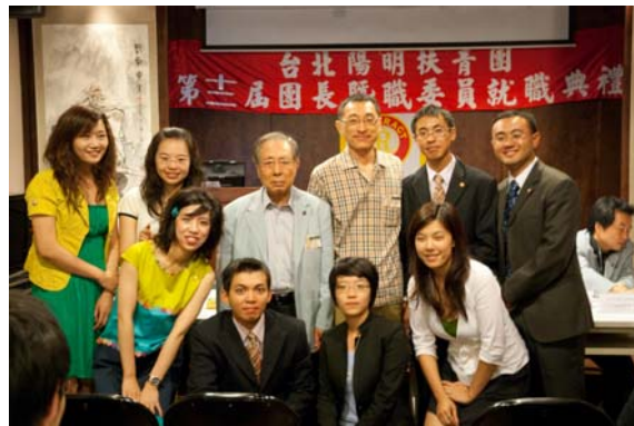
陽明扶青大躍進就靠 P.P.POWER 啦