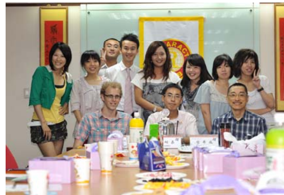
謝謝 P.P.CONTAINER 提供會議室