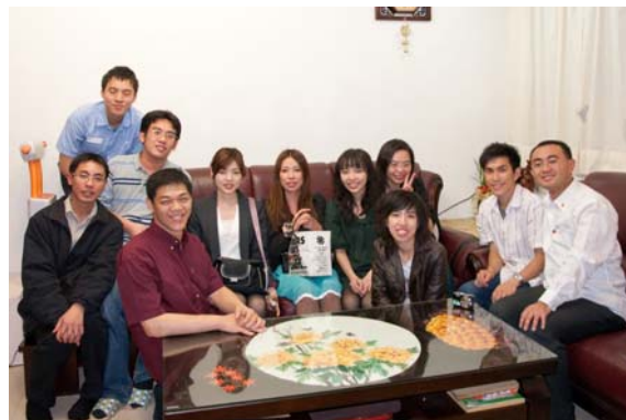
歡迎天滿橋扶青團參加陽明扶青團慶