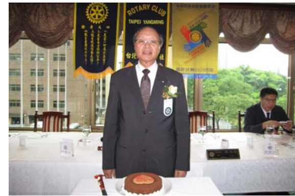
放心!老婆生日 P.P JOHN 不會忘啦