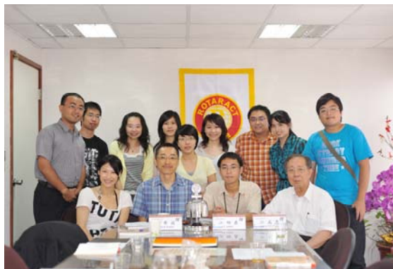
扶青職業講座-良好生活習慣的養成