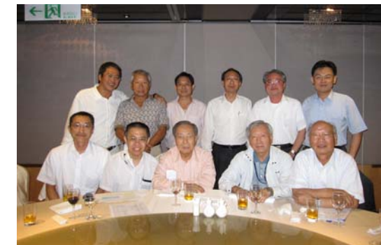
請別忘 0919 的授證 33 週年慶典活動