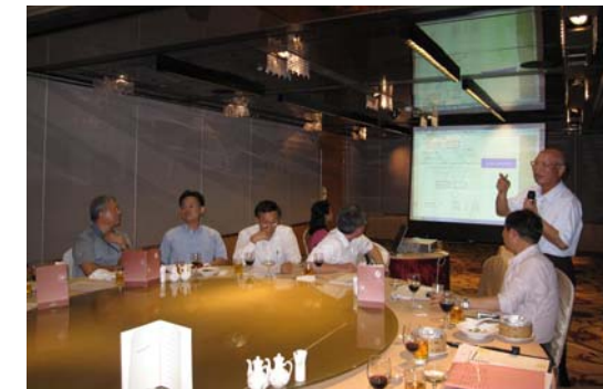
超認真的社員發展主委 P.P.MAC