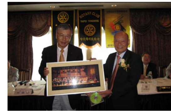
ONE DAY WHEN WE WERE YOUNG