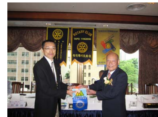
謝謝 WAGNER 帶我們進入瑪麗亞·卡拉絲的藝術世界

社長：宿希成 第三十五屆社長當選人：陳添桂 副社長：郭伯嘉 秘書：張歐誠 社刊主委：葉政彥 辦事處：106 台北市仁愛路四段 77 號 5F TEL: (02) 2752-3410 2752-2764 FAX: (02) 2781-3331 例會：每週二中午 12:00 在福華飯店 4F 羅浮宮舉行