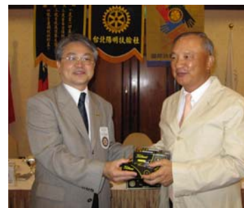
P.P.ERIC 笑 P.P.AGENT 試打銀 TEE 反而不適應