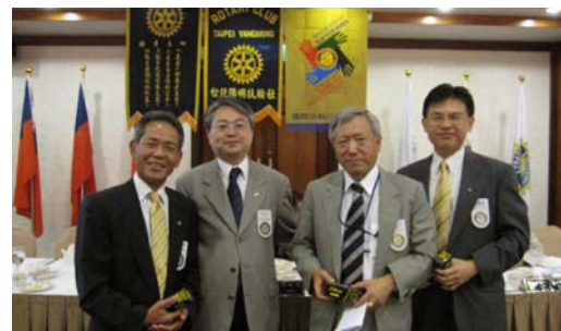
P.P.MASA 獲得 LUCKY 7 ? 幾人參賽?