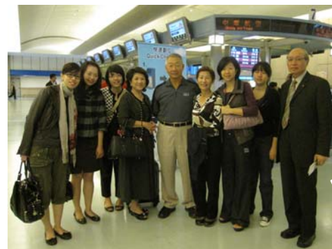
ROME0 專程到機場送機-感動啲