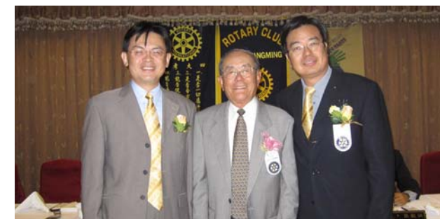
真巧! 每年的11月26日都是結婚的好日子