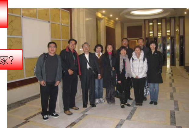
職業參觀 P.P. JACK 的西城天下