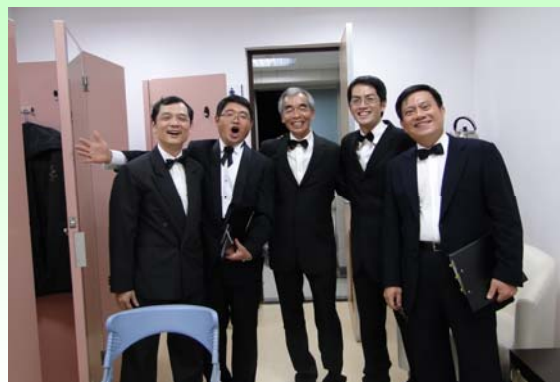
恭禧台大 EMBA 合唱團成功的演出!