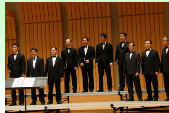
陽明社友是不是也來組個合唱團?