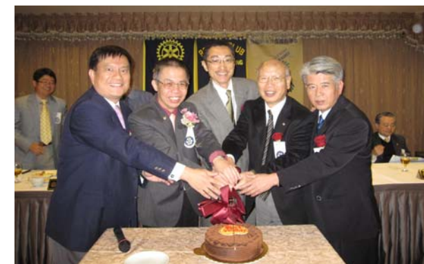
12 月份喜慶特別多.. 因為娶個老婆好過年?