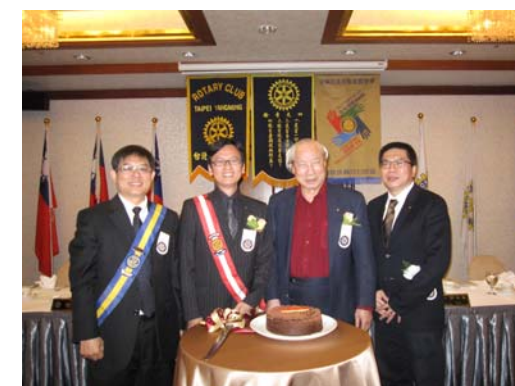
提早慶生也是不錯的安排啦！