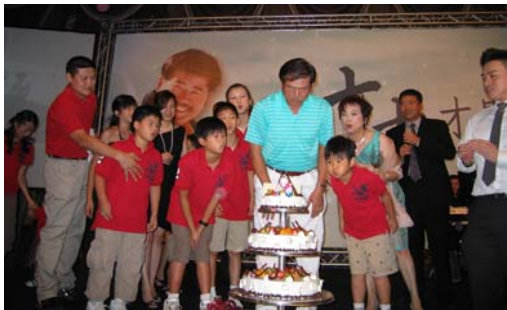
99.07.09 六福皇宮 永康殿 洋洋喜氣 大大歡樂