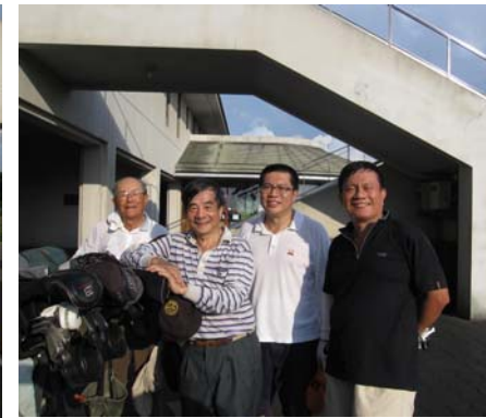
聽說這四位聊得很爽