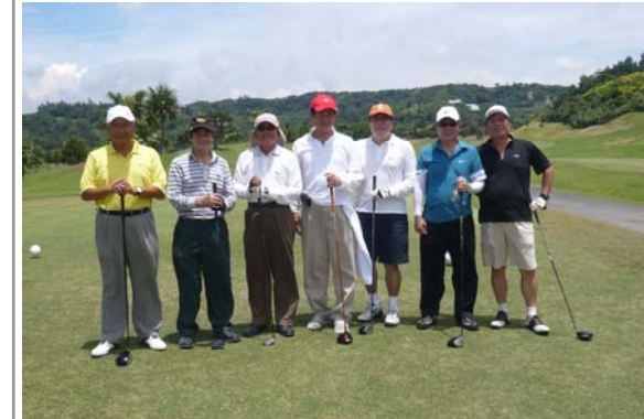
TONY 已經被悄悄鎖定目標還渾然不知