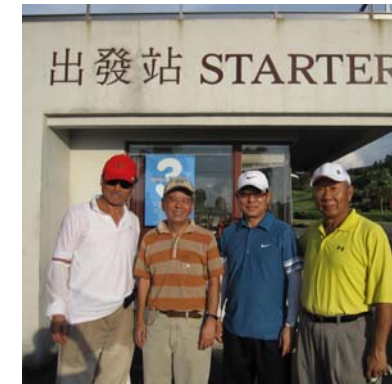
果然 TONY 成了散財童子