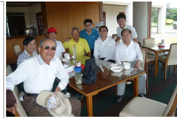
藏鏡隊長 P.E.B.J. 終於露臉啦!