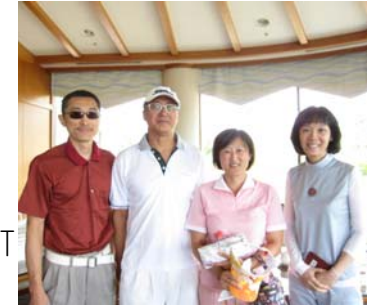
最後一組囊括前三名!