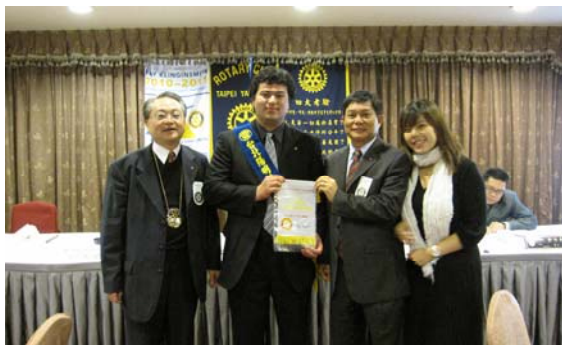
歡迎陽明扶青新血輪

不論其為何種方式，扶輪青少年領袖營計劃為地區內扶輪社員提供不僅為青少年做事，而是與青少年共事的一項挑戰性服務，是在各種當代問題的環境中培養青少年領袖才能之有效方法。