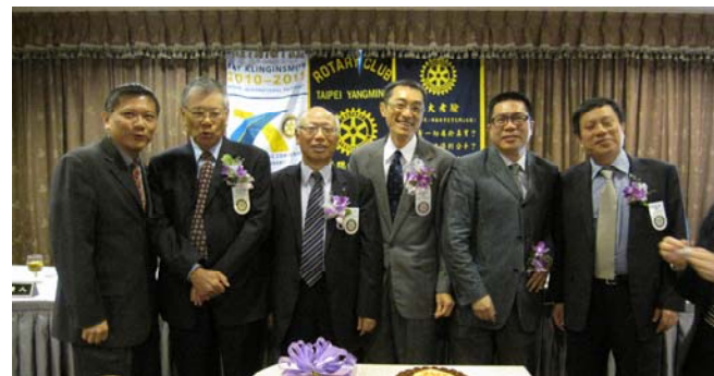
敬祝“諸”公健康快樂!!