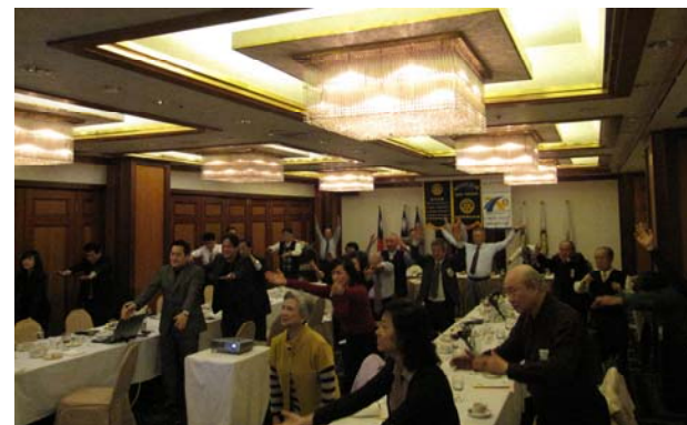
許久未見的熱鬧場面